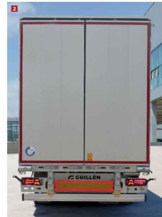
[1] Lona Corredera Aero [2] Trasero