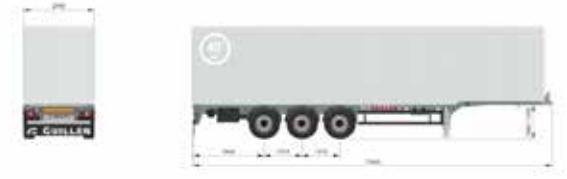
PC-40 HC X Light