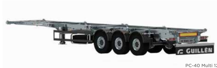
PC-40 Multi 12

* Selon les termes et conditions des traitements de surface GDI, EURL.