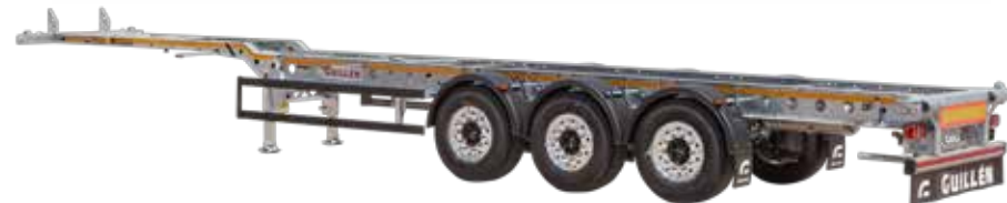
PC-45/40 HC X Light