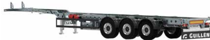
PC-40 HC X Light