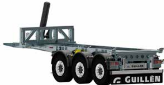
PC-20 3ES Tipper