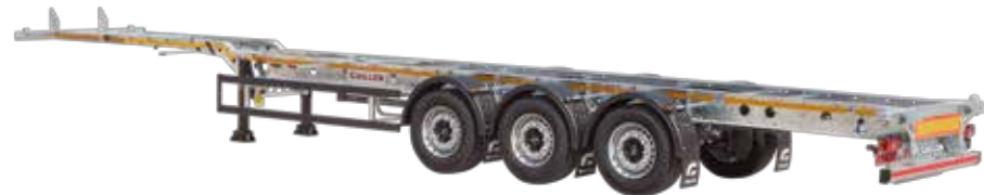
PC-45 HC X Light