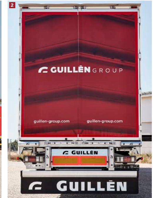
[1] Semirremolque DFV [2] Trasera semirremolque DFV